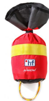
Corde de sécurité HF 18m

Le gilet ORCO PRO est un gilet fonctionnel et confortable pour l'eau vive. Idéal pour l'encadrement, il est équipé de deux poches ventrales, d'une pochette pour le rangement des clés et d'un carré à couteau.