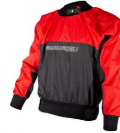
Coupe vent Racing

Coupe vent léger qui offre une grande liberté de mouvement, idéal pour débuter en kayak