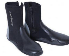
Bottillon néoprène Alpine

Pagaie 1 partie, idéale pour les pratiquants à la recherche d'une pagaie résistante et endurante.