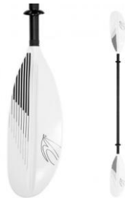
Pagaie kayak Viva

Equipement néoprène double-face unisexe, idéal pour la pratique du canoë-kayak.