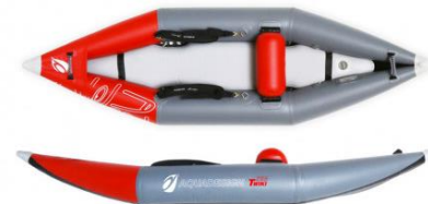
Kayak Twiki 1 ou 2 places

Idéal pour toute embarcation : kayak gonflable, sit-on-top, stand up paddle.