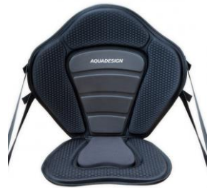
Siège kayak Fusion

Manchons en néoprène double-face 3mm pour affronter marée et vents au chaud.