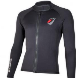
Bolero néoprène Spark

Idéal pour la pratique régulière du kayak en eau vive, il permet de rester au chaud et au sec