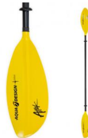
Pagaie kayak Attak 1

Pagaie double 1 partie en aluminium, idéal pour les débutants.