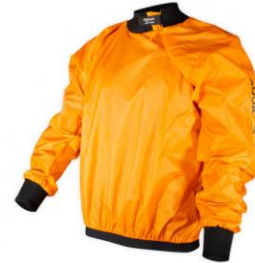
Coupe vent Touring

Casque réglable avec protection intégrale du crâne et des oreilles.