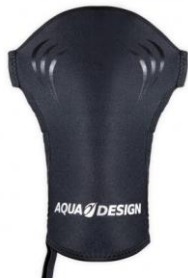
Manchon Néoprène Manok

Merci de nous contacter à l'adresse eshop@ffck.org pour un devis adapté.